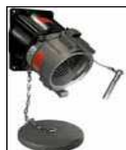
Socle Mural (Femelle)