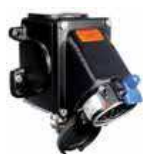
Socle Mural (Femelle)